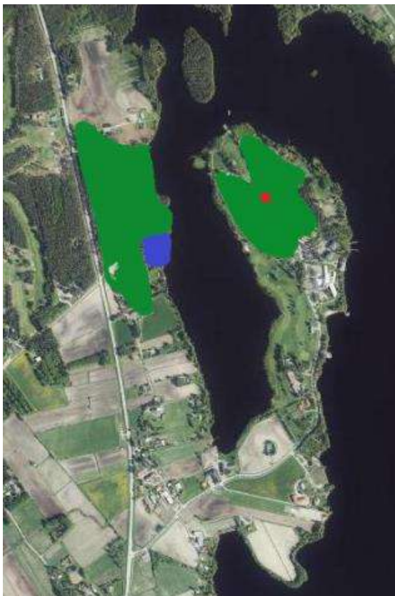
Kuva 2. Suunnittelualueen metsät ovat pääpiirteissään vihreällä merkittyjä tuoreen kankaan VMT-metsiä. Punaisella pisteellä on merkitty jättipalsamin esiintymä. Sinisellä on merkitty rehevämpi ruohokasvillisuus.