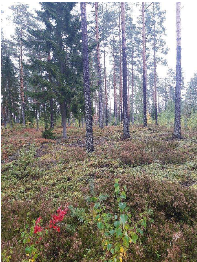
Kuva 5. Herneslahden VMT-tyyppin metsää.