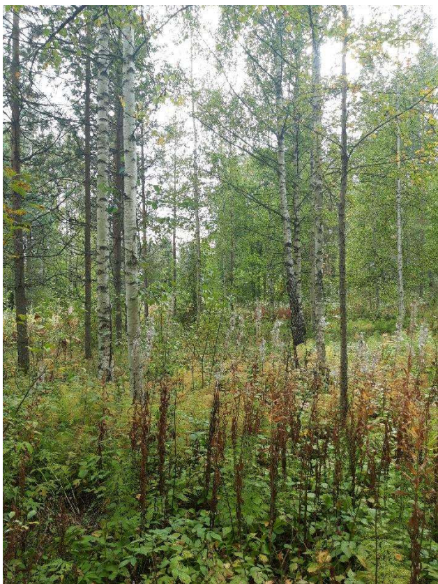
Kuva 6. Herneslahden rehevämpi metsälaikku.