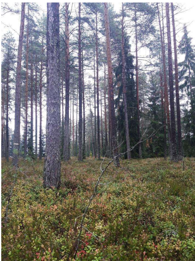
Kuva 3. Nykälänniemen mäntyvaltaista VMT-metsää, jossa kasvaa sekapuuna kuusta.