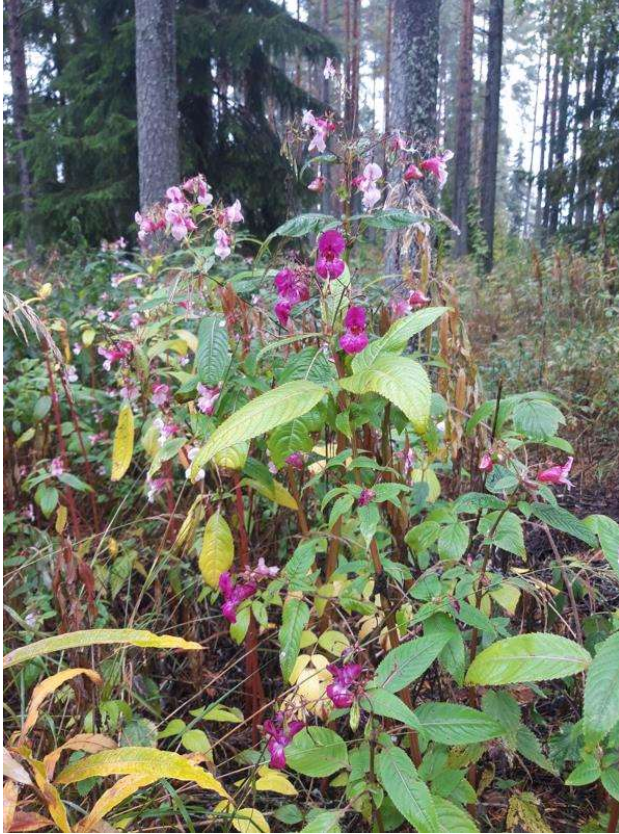
Kuva 4. Nykälänniemessä kasvaa pienellä alalla jättipalsamia.

Nykälänniemen kärjestä on suunniteltu rakennettavan silta Kyrönsaareen. Suunnittelun sillan rakennuspaikalla kasvillisuus on tavanomaista. Lähistöllä on myös kota ja venelaituri. Ideasuunnitelman mukaan silta on tarkoitus rakentaa vedessä lähellä olevan ruovikon viereen ja ruovikon keskelle tehdään katselutasanne.