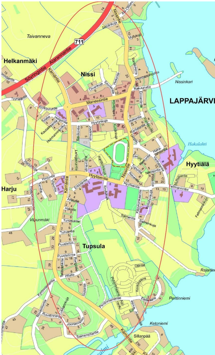
Kuva 1. Suunnittelualueen sijainti

Suunnittelualue muodostuu kunnan omistamista maa-alueista.