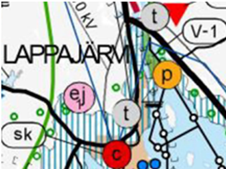
Kuva 2. Ote E-P:n maakuntakaavasta.

Etelä-Pohjanmaan maakuntakaavassa kaavoitettava alue kuuluu taajamatoimintojen alue (vaalea täyttö), kulttuuriympäristön tai maiseman vaalimisen kannalta tärkeä alue (sininen pystyviiva), matkailun vetovoima-alue (vihreä paksuviiva), Palvelujen alue (p).