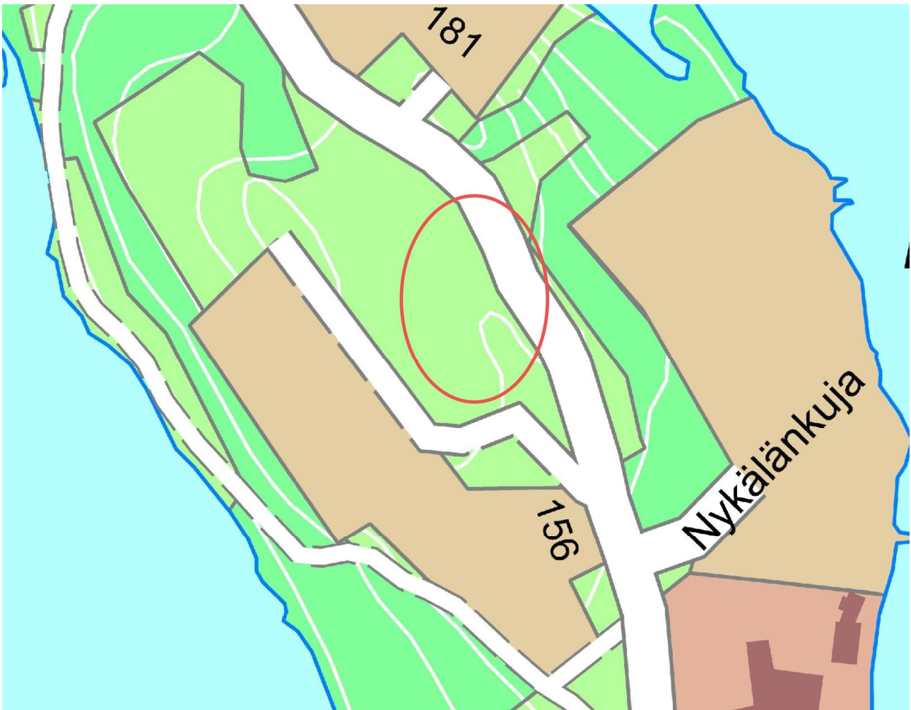
Kuva 1. Suunnittelualueen sijainti

Suunnittelualue muodostuu kunnan omistamista maa-alueista.