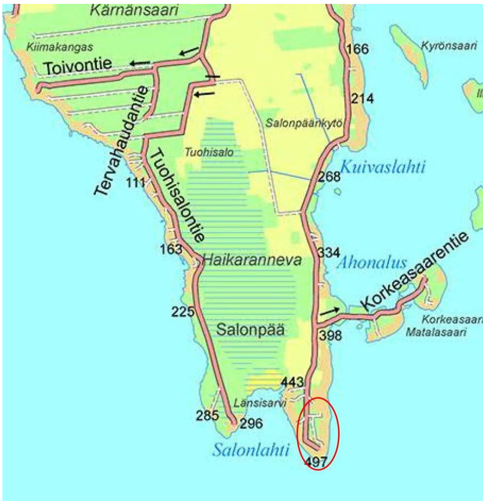
Kuva 1. Suunnittelualueen sijainti

Suunnittelualue muodostuu yksityisen omistamista maa-alueista.