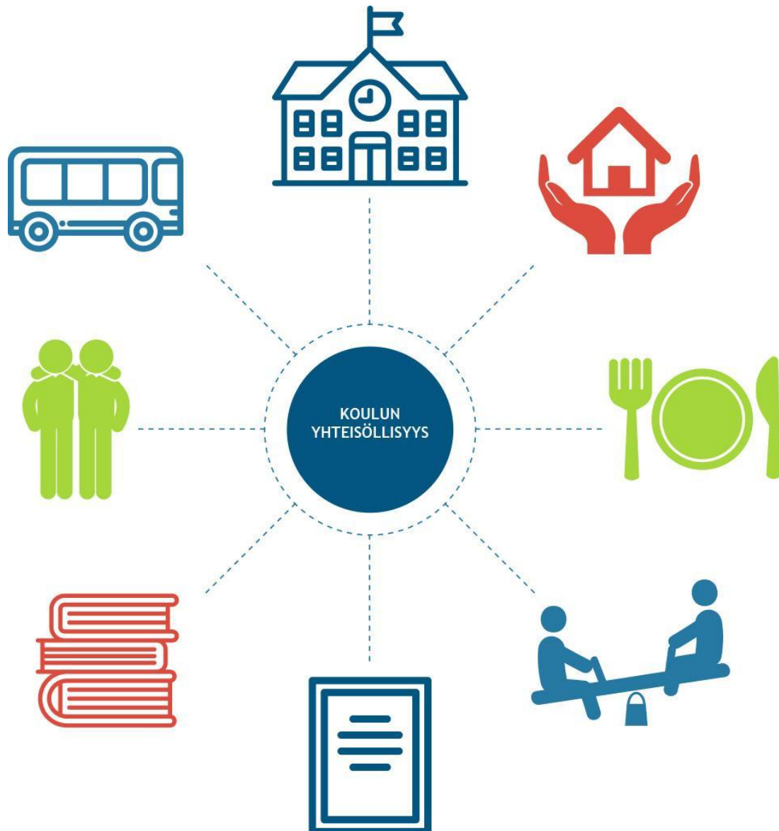
KUVIO Koulun yhteisöllisyys